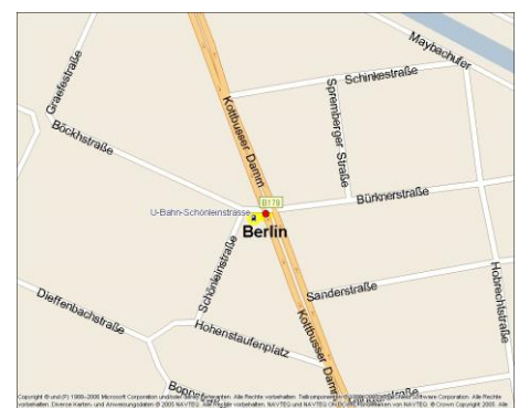
Schönleinstr. 35/Kottbusser Damm 13, 10967 Berlin

Dieses freibleibende Angebot ist für den Mieter provisionsfrei. Irrtum und Zwischenvermietung vorbehalten.